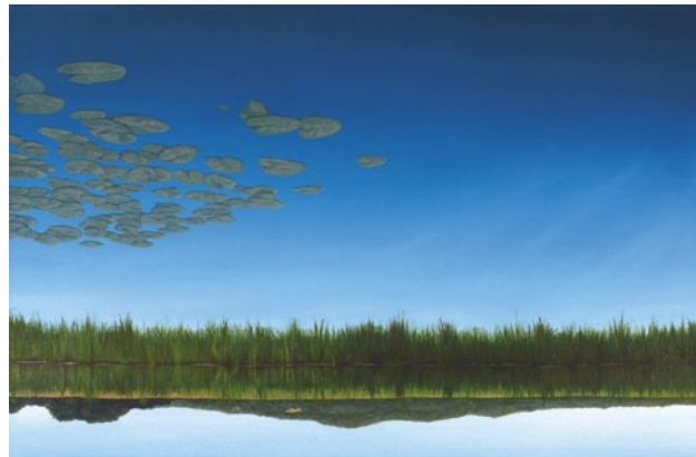
Stefan Ringeling, Spiegel, 2010, 95x60 cm, präsentiert in der Worpsweder Kunsthalle