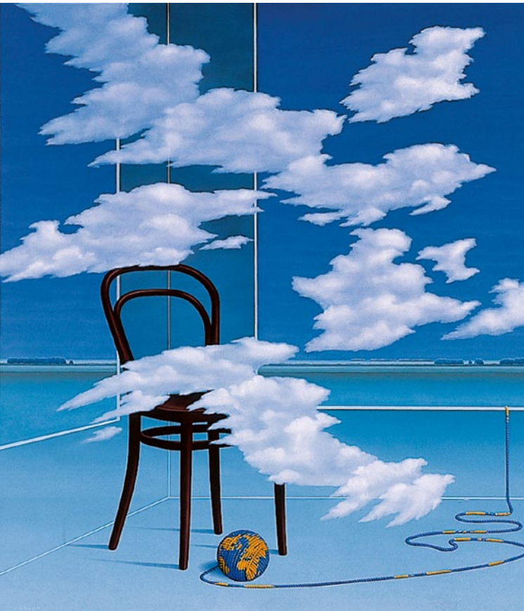
Abbildung Titel: Franke Mitge, Innen, 1997, -Crestaltung: www.studio37.de