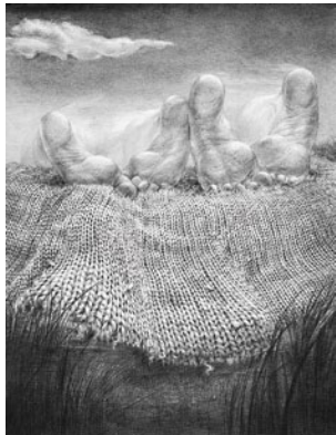
Beata Kornicka-Konecka, Kumulus , 2012, 54 x 70 cm, präsentiert in der Galerie ART99

Die Worpssweder Kunsthalle zeigt eine eigens für die Biennale kuratierte Ausstellung. Gemälde und bildhauerische Arbeiten sowie Fotografien von Künstlern und Künstlerinnen, die heute als anerkannte Vertreter des zeitgenössischen Worpssweder Kunstgeschehens gelten, treten auf äußerst reizvolle Weise in direkten Dialog mit Exponaten jener Künstler, die um 1900 den Ruhm Worpsswedens als Künstlerkolonie begründeten.