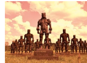
Zbigniew Brancusi, Die Eisernen Männer, Eisen, Höhe 220 cm

Schwerpunkt der ersten Biennale unter dem Titel „Zwischen den POLen“ ist der Gründungszeitraum der europäischen Künstlerkolonien. In dieser Zeit des Aufbruchs, der Geburtsstunde des Jugendstils, des Übergangs vom Impressionismus zum Expressionismus und von der Fotografie zum Film haben sich Künste und Künstler gegenseitig befruchtet und einen gesellschaftlichen Wandel mitbegründet. Mit Dokumentar- und Spielfilmen, Kunstausstellungen, Literatur, Diskussionen und Künstlergesprächen wird ein gleichermaßen lebendiges wie unterhaltsames Bild