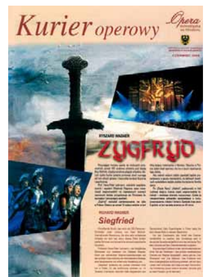
Wagners Ring des Nibelungen