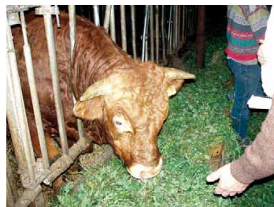
Wirtschaftliche Strategien für kleinbäuerlich strukturierte Betriebe in der regionalen und ökologischen Landwirtschaft – eine Informationsreise für Bauern und Bäuerinnen aus der Gemeinde Zamość 39