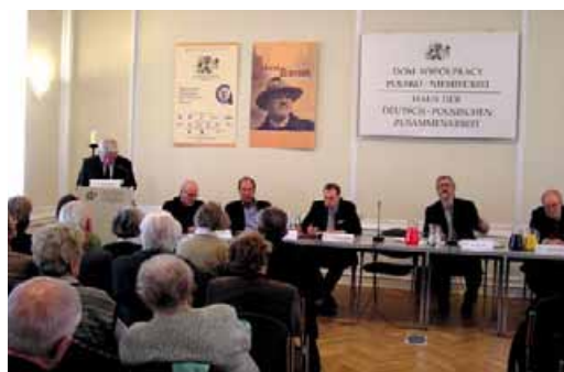
177 Feierliche Gedenkveranstaltung aus Anlass des 15. Todestages von Horst Bienek