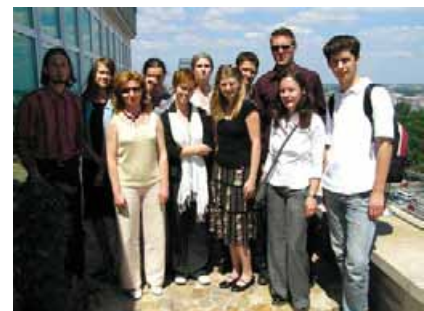
Treffen mit den SdpZ-Stipendiaten

Mit der noch relativ kleinen Zahl von Alumni versucht die SdpZ Kontakt zu halten. 2005 lud sie Stipendiaten aus dem gemeinsamen Stipendienprogramm der GFPS und SdpZ sowie aus dem Stipendienprogramm „Blindengermanistik an der Katholischen Universität Lublin“ nach Warschau ein.