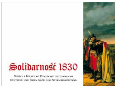
Ausstellung Solidarität 1830