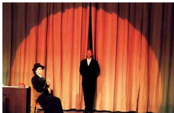
142 Festival baz@rt.de/ch – Präsentationen