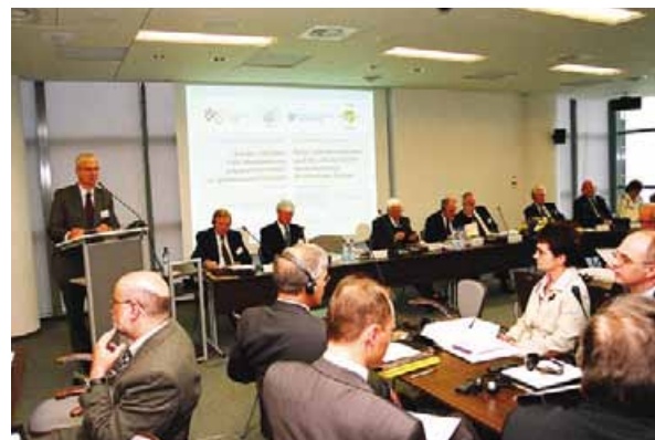
Wirtschaftskonferenz in den Tagungsräumen der SdpZ

RK: Deutschland ist das ökonomisch gewichtigste Land der alten EU-15, Polen ist das größte Land der neuen 2004 beigetretenen Länder. Allein schon wegen dieser Sonderstellung erwächst beiden Staaten eine besondere Verantwortung für das vereinte Europa. Polen hat nach dem Vertrag von Nizza 27 Stimmen im EU-Ministerrat und damit fast so viele wie Deutschland, Frankreich, Italien und das Vereinigte Königreich, die jeweils über 29 Stimmen verfügen. Dadurch wächst dem polnischen Staat bei der weiteren Gestaltung der EU zudem eine hohe politische Verantwortung zu.