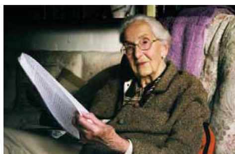
65 Dokumentarfilm „Die Schlacht um Warschau“